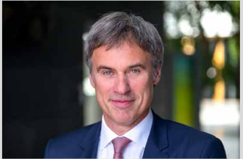
Achim Berg, Präsident des Bitkom.

„Das Klimaziel 2030 im Verkehrssektor ist erreichbar, wenn die Möglichkeiten digitaler Technologien umfassend genutzt werden. Dabei geht es nicht nur darum, Fahrzeuge zu automatisieren, effizienter zu machen und auf neue Antriebstechnologien zu setzen. Dank Digitalisierung kann Verkehr reduziert werden, etwa indem Parkplatzsuchverkehr mit Hilfe intelligenter Verkehrssteuerung vermieden wird oder durch die Vernetzung von Mobilitätsangeboten wie Bus, Bahn, Car- und Bike-Sharing komfortable Alternativen zum motorisierten Individualverkehr entstehen. Digitalisierung kann aber auch dabei helfen, Verkehr völlig zu vermeiden, etwa indem Pendler nicht mehr mit dem Auto zur Arbeit fahren, sondern tageweise von zu Hause aus dem Homeoffice